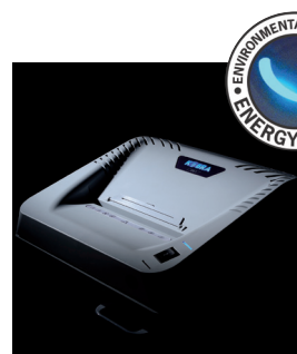
ENERGY SMART ®

SYSTÈME D'ENTRAÎNEMENT PUISSANT à chaîne robuste avec des engrenages en métal