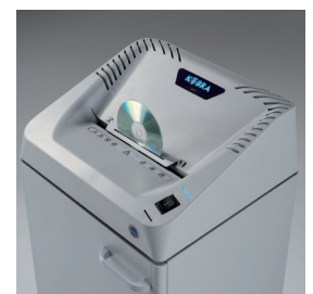
DÉMARRAGE AUTOMATIQUE & DECHIQUETE DES CD

Système de gestion avec des indicateurs lumineux pour économie d'énergie en mode veille