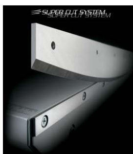
SYSTEME "SUPER CUT"

Lames et contre-lames en acier trempé au carbone avec un aiguisage à 65 ° pour des opérations de coupe durables.