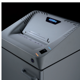
Témoin Lumineux LED

SYSTÈME D'ENTRAÎNEMENT PUISSANT à chaîne robuste avec des engrenages en métal 24 HEURES EN CONTINU, MOTEUR ROBUSTE fonctionnement 24 heures sans surchauffe BLOC DE COUPE couteaux de carbone durci non affectés par les agrafes ou les trombones. ENERGY SMART ® passe en mode veille après 8 secondes d'inactivité DÉMARRAGE ET ARRÊT automatique grâce aux yeux électroniques avec fonction veille ARRÊT DE SÉCURITÉ automatique avec signal lumineux pour sac plein et / ou porte ouverte SYSTÈME DE RENVERSE automatique en cas de blocage CABINET pratique de 110 Litres monté sur roulettes