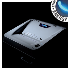
ENERGY SMART ®

SYSTÈME D'ENTRAÎNEMENT PUISSANT à chaîne robuste avec des engrenages en métal