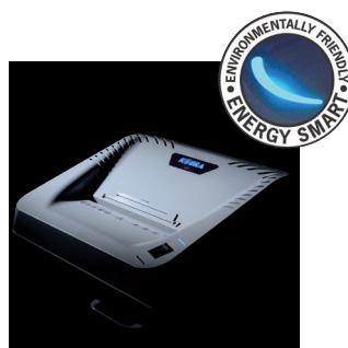
ENERGY SMART ®

SYSTÈME D'ENTRAÎNEMENT PUISSANT à chaîne robuste avec des engrenages en métal