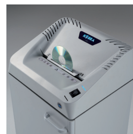
Démarrage automatique & Destruction Cd

Passe en mode veille après 8 secondes d'inactivité